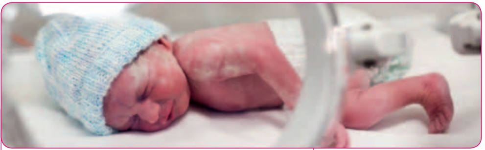
Baby in couveuse